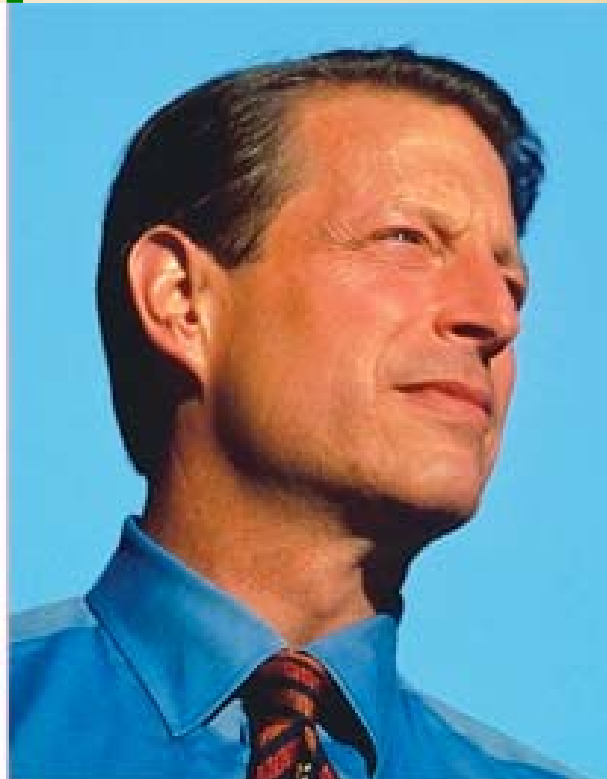
siegte gegen Al Gore wegen