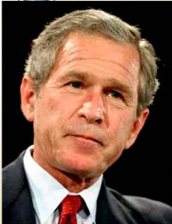
George W. Bush