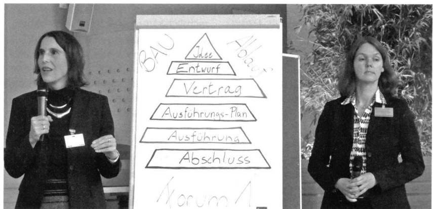
Konflikte am Bau – „spielerisch“ gelöst mit Mediation.