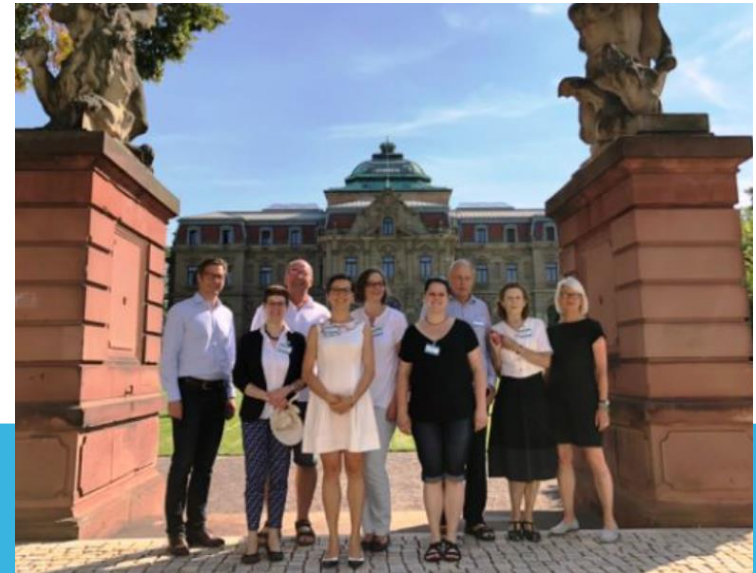
Karlshochschule International University 2018