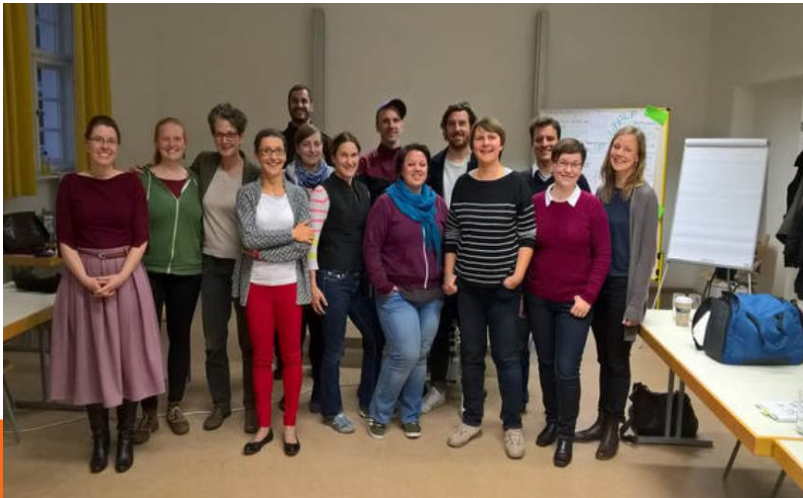
Katholische Hochschule für Soziale Arbeit Berlin 2017