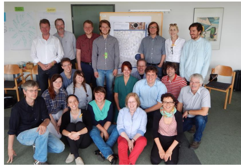
Universität Hamburg 2016